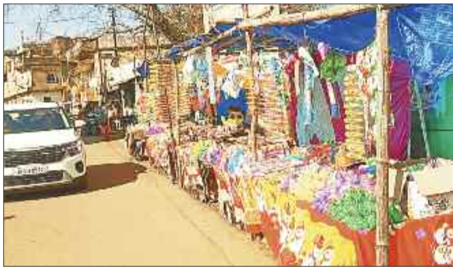
रंगों और पिककारियों से सजी दुकानें।