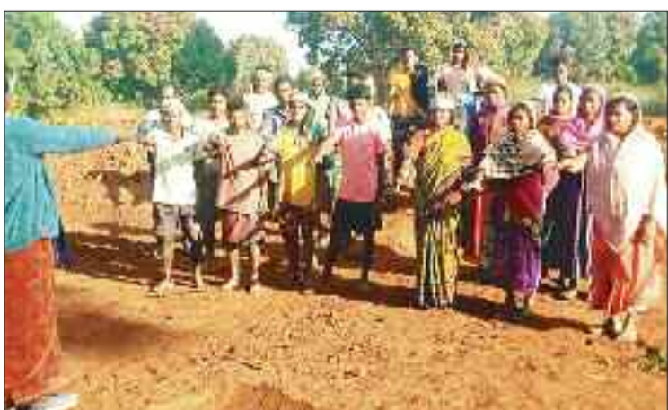
शपथ लेते मजदूर।

इसी तारतम्य में जिले के बगीचा जनपद पंचायत अंतर्गत पंडरापाट, बूटगा, सामरबार, बंबा, सुलेसा, दुलदुला जनपद पंचायत अंतर्गत लोरो, चटकपुर, गट्टीमुदा, जशापुर जनपद पंचायत अंतर्गत