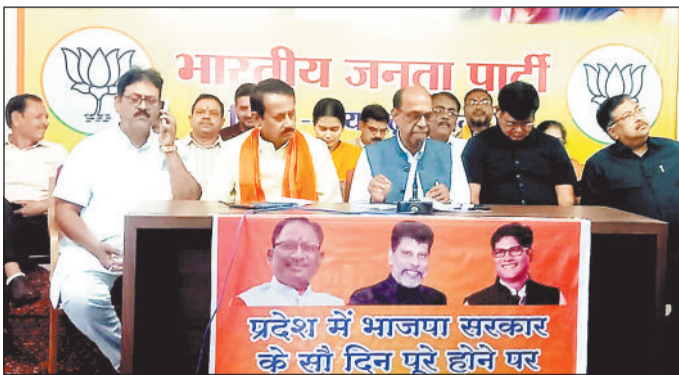
प्रवर्तनी लेते भाजपा पदाधिकारी।

8 लाख आवासहीन परिवारों को आवास हमने पहली कैबिनेट में ही छत्तीसगढ़ के 18 लाख आवासहीन परिवारों को आवास उपलब्ध कराने का अभूतपूर्व निर्णय लिया। मुख्यमंत्री अपने अधिकारिक निवास में वादे के अनुरूप ही बाद में गए। पहले उन्होंने वर्ष 2023-24 के अनुसूचक बजट में 3,799 करोड़ रूपए और वर्ष 2024-25 के बजट में 8,369 करोड़ रूपए इस प्रकल कुल 12.168 करोड़ रूपए का प्रावधान किया। प्रधानमंत्री आवास योजना के हितग्राहियों की आवास निर्माण के लिए निःशुल्क रेशे उपलब्ध कराई जा रही है। दो वर्षों के खान पूर्व प्रधानमंत्री श्रद्धेय अटल के जन्मदिन सुशासन दिवस के